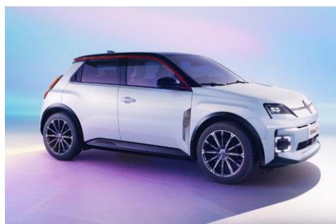
biserno bijela (3)