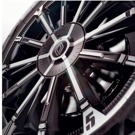
45-cm (18") naplatci Chrono