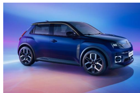
plava Nocturne (2)