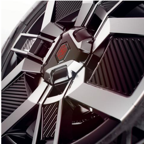
45-cm (18") naplatci Techno