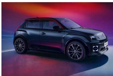
crna Etoile (2)