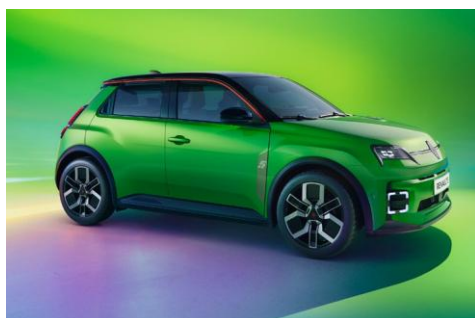
zelena Pop! (1)